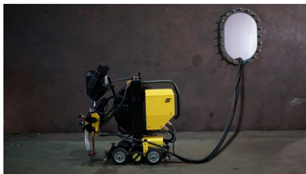
模块化设计，适用于难以到达的地点