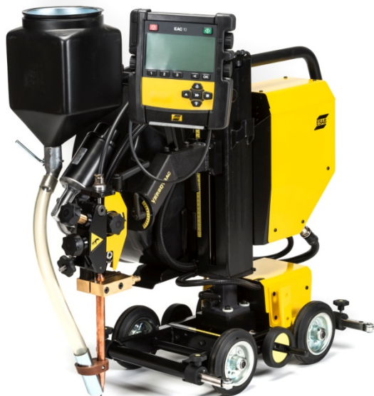
Versotrac埋弧焊小车四轮版本

凭借70余年的焊接小车制造经验，伊萨为您提带来一款非常灵活且能胜任各种用途的小车。Versotrac的设计充分考虑了世界各地焊工的实际经验。